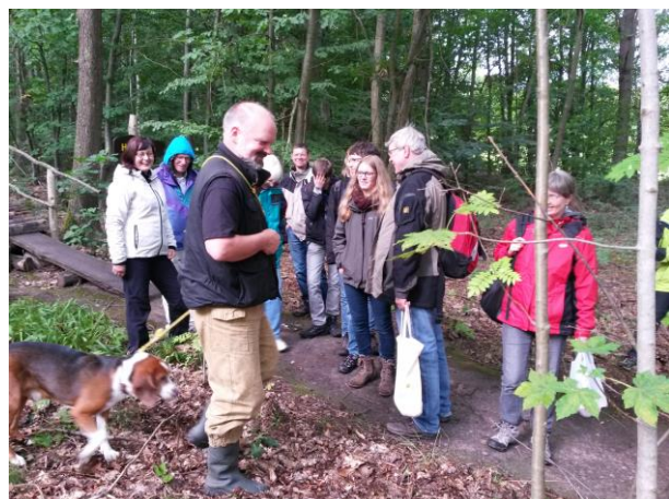
...während der Pilzführung