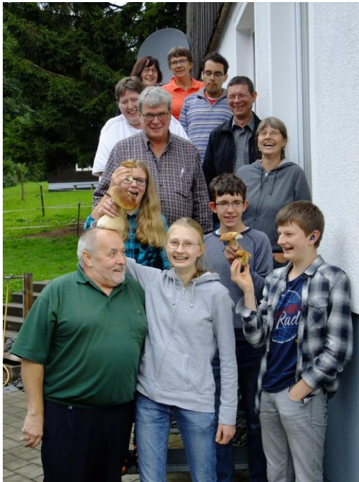
...nach der Pilzführung