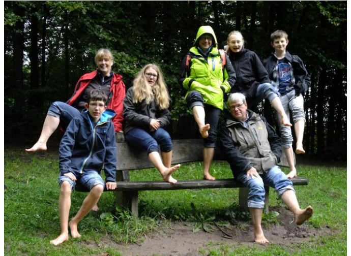
...nach dem Barfußpfad