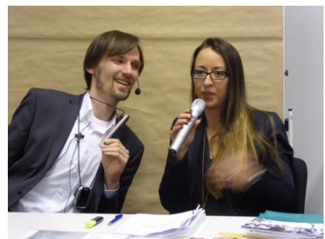
...unsere Referenten - zum Glück keine Berührungängste bei der Verwendung von Hilfsmitteln