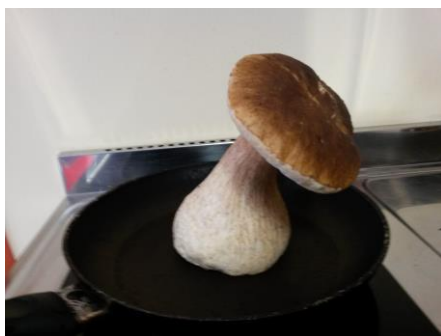
...zum Braten fast zu schade

Nach dem guten Anklang im letzten Jahr fand auch dieses Familienwochenende als „Familienwochenende light“ statt mit der Option zur Übernachtung für den „harten Kern“ 😊. Gestartet wurde mit einem gemütlichen Frühstück im Gruppenraum, zu dem jeder etwas mitbrachte. So gab es reichlich zu essen und genug Zeit, um sich mit den anderen Teilnehmern auszutauschen, was nicht nur sehr informativ sondern auch sehr unterhaltsam war. Leider war uns das Wetter bei der geführten Pilzexkursion nicht sehr wohl gesonnen, aber dafür lohnte sich die Ausbeute, die beim anschließenden Grillen gleich verwertet wurde. Für die Tagesgäste wurde es dann langsam Zeit nach Hause zu fahren. Die Übernachtungsgäste machten sich noch einen schönen Abend leider ohne Lagerfeuer, da es so nass war. Aber in guter Gesellschaft und mit vielen Gesellschaftsspielen wurde der Abend sehr lustig. Am Sonntag ging es noch auf den Barfußpfad und in die Turnhalle mit Tischtennis und Kicker, bis es nach einem gemeinsamen Mittagessen und aufräumen wieder nach Hause ging.